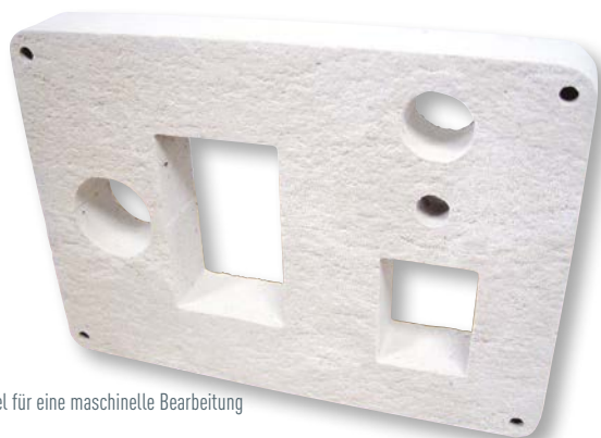
Beispiel für eine maschinelle Bearbeitung

ODIBOARD können in unserem Betrieb entsprechend Ihren Zeichnungen in breiten oder schmalen Streifen auf Maß geschnitten und maschinell bearbeitet werden.