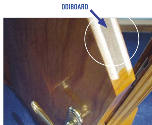
Anwendungsbeispiel: Odiboard als Kernmaterial für Metall- und Holztüren.